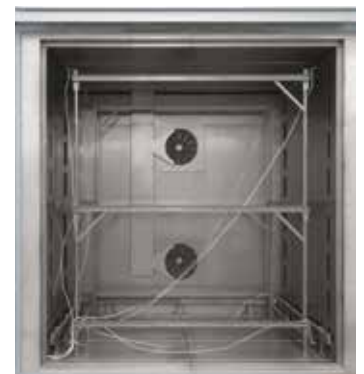
Telaio da assemblare per la misurazione nel forno a convezione N 7920/45 HAS