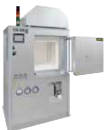
HT 160/17 DB200 per il deceraggio e la sinterizzazione delle ceramiche dopo la stampa 3D

Additive manufacturing consente di convertire direttamente files di progettazione in oggetti finiti completamente funzionali. Con le stampanti 3D, partendo da una massa di metallo, plastica, ceramica, vetro, sabbia o altri materiali, gli oggetti vengono creati strato dopo strato fino a raggiungere la loro forma definitiva.