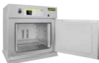
Essiccatore ad armadio TR 240 per l'essiccamento delle polveri