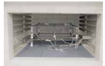
Struttura di misurazione in un forno di cottura