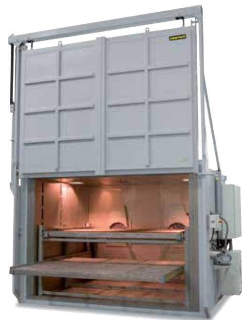
N 12012/26 HAS1 secondo AMS 2750 E

In alternativa alla strumentazione mediante regolazione PLC e Nabertherm Control-Center (NCC) può essere offerta una strumentazione con regolatori e termografi. Il termografo dispone di una funzione di protocollo che può essere configurata manualmente. I dati possono essere trasferiti su un pennino USB e analizzati, formattati e stampati su un PC a parte. Altro al termografo integrato nella strumentazione standard è necessario un dispositivo a parte per le misurazioni TUS (vedi pagina 80).