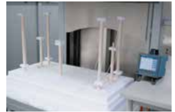
Struttura di misurazione in un forno ad alta temperatura