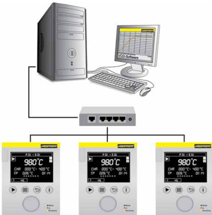
Esempio di configurazione con 3 forni