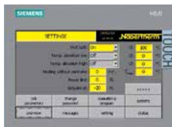
H1700 con visualizzazione in forma tabellare, a colori