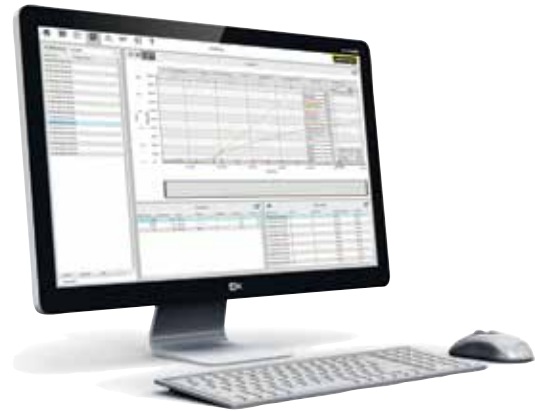
Software VCD per gestione, visualizzazione e documentazione

Il software VCD serve per la registrazione dei dati di processo dei controller B400/B410, C440/C450 e P470/P480. È possibile memorizzare fino a 400 diversi programmi di trattamento termico. I controller vengono avviati e arrestati via software. Il processo viene documentato e archiviato. La visualizzazione dei dati può avvenire in un diagramma o come tabella. È inoltre possibile trasferire i dati di processo a MS Excel (in formato *.csv) oppure creare un rapporto in formato PDF.