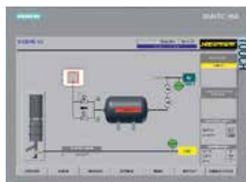
H3700 con visualizzazione grafica

Nabertherm ha un'esperienza pluriennale nella progettazione e costruzione di impianti di regolazione standardizzati e personalizzati. Tutti i controlli si contraddistinguono per un'estrema facilità di utilizzo e dispongono già nella versione base di numerose funzioni utili.