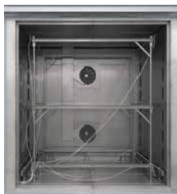
Telaio da assemblare per la misurazione nel forno a circolazione d'aria N 7920/45 HAS

Viene detta uniformità della temperatura una determinata deviazione massima della temperatura presente nello spazio utile del forno. Di principio viene fatta distinzione tra la camera del forno e lo spazio utile del forno. La camera è il volume totale disponibile all'interno del forno. Lo spazio utile è più piccolo della camera ed è il volume utilizzabile per il caricamento.