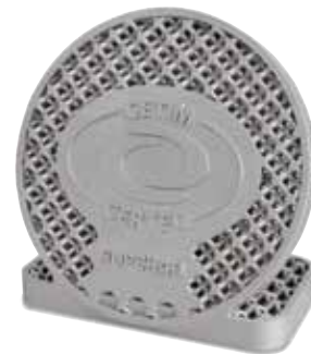
Componente stampato in alluminio, sottoposto a trattamento termico nel modello N 250/85 HA (fabbricante CETIM CERTEC su piattaforma SUPCHAD)

Data l'ottima uniformità della temperatura, i forni a camera a convezione sono indicati per processi come ad esempio il rivestimento, l'invecchiamento artificiale, la distensione o il preriscaldamento.