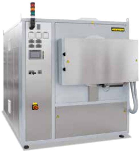
Forno a storte a pareti calde NRA 150/09 per trattamenti termici in atmosfera di gas inerte.

Nel caso di materiali sensibili, come ad esempio il titanio, è possibile che, a causa del contenuto di ossigeno residuo nella cassetta di gasaggio, si verifichi un'ossidazione del componente.