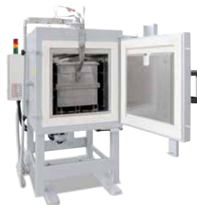
Forno a camera a convezione N 250/85 HA con cassetta di gasaggio per trattamenti termici in atmosfera di gas inerte

I modelli indicati nella tabella rappresentano solo alcuni esempi.