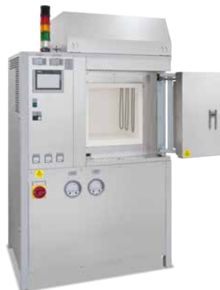
Forno ad alta temperatura HT 64/17 DB100 con sistema di sicurezza passivo per il deceraggio e la sinterizzazione all'aria