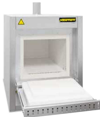
Forno a muffola L 40/11 BO con sistema di sicurezza passivo e postcombustione integrata per il deceraggio termico all'aria

2 I forni sono disponibili con diverse temperature massime della camera del forno