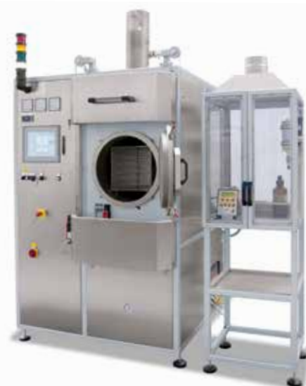
Forno a storte NRA 40/02 CDB con armadio per la pompa acida

3 Con cassetta di processo per il deceraggio residuo