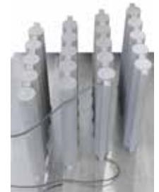
Tiranti in titanio dopo il trattamento termico nel NR 50/11 in atmosfera di argon