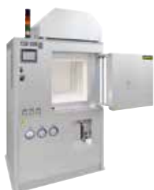
HT 160/17 DB200 per il deceraggio e la sinterizzazione delle ceramiche dopo la stampa 3D

Additive manufacturing consente di convertire direttamente files di progettazione in oggetti finiti completamente funzionali. Con le stampanti 3D, partendo da una massa di metallo, plastica, ceramica, vetro, sabbia o altri materiali, gli oggetti vengono creati strato dopo strato fino a raggiungere la loro forma definitiva.