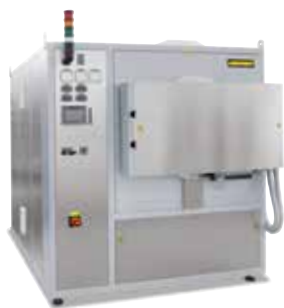
Forno a storta NR 150/11 per la distensione di componenti in metallo dopo la stampa 3D