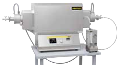
Forno tubolare compatto per la sinterizzazione o la distensione dopo la stampa 3D in gas inerte o sotto vuoto