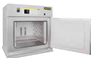
Essiccatore ad armadio TR 240 per l'essiccamento delle polveri