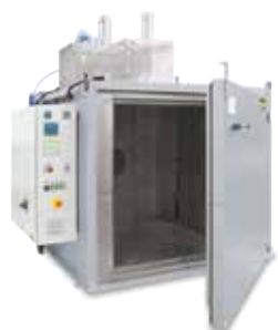
Essiccatore a camera KTR 2000 per polimerizzazione del legante dopo la stampa 3D