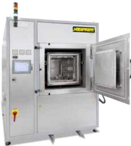
Forno a storte a pareti fredde VHT 100/12-MO per processi in alto vuoto

Per i processi in gas inerte oltre 1100 °C o sottovuoto oltre 600 °C si utilizzano i forni a storte a pareti fredde.