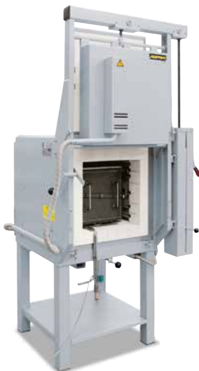
Forno a camera a convezione LH 60/12 HA con cassetta di gasaggio per trattamenti termici in atmosfera di gas inerte

1 Disponibili con diverse temperature massime della camera del forno e riscaldatori di materiali diversi