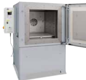
Forno a camera a convezione NA 250/45 per trattamento termico all'aria