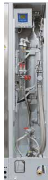
Depuratore dei gas di scarico per la pulizia dei gas di processo mediante lavaggio

Un depuratore di gas viene spesso utilizzato quando si formano gas di scarico che non possono essere trattati con un post-bruciatore termico o una torcia, per pulire, decontaminare o disintossicare i gas di scarico si utilizza un liquido di lavaggio. I componenti indesiderati dei gas di scarico vengono separati da un fluido di lavaggio all'interno del dispositivo di lavaggio. Selezionando il liquido di lavaggio idoneo e dimensionando la distribuzione del liquido e la sezione di contatto è possibile adattare il dispositivo di lavaggio al processo, eliminando dal gas di scarico componenti gassose, liquide o anche solide.