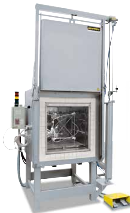
Supporto di misurazione per la determinazione dell'uniformità della temperatura

Nel forno standard è garantita un'uniformità della temperatura in +/- K senza la necessità di misurare il forno. Come dotazione aggiuntiva è tuttavia possibile ordinare la misurazione dell'uniformità della temperatura a una temperatura nominale definita nello spazio utile secondo DIN 17052-1. In base al modello del forno, nel forno si allestisce un supporto corrispondente alle dimensioni dello spazio utile. Delle termocoppie vengono fissate in questo supporto, in posizioni di misurazione definite (11 con sezione rettangolare, 9 con sezione circolare). La misurazione della distribuzione della temperatura si svolge a una temperatura nominale definita dal cliente, dopo un tempo di tenuta precedentemente stabilito. Se richiesto, è possibile calibrare anche temperature nominali diverse o un determinato intervallo di temperatura.