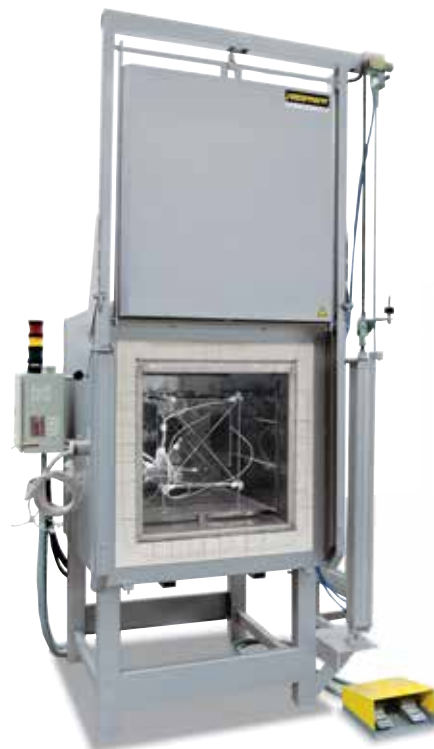
Supporto di misurazione per la determinazione dell'uniformità della temperatura

Nel forno standard è garantita un'uniformità della temperatura in +/- K senza la necessità di misurare il forno. Come dotazione aggiuntiva è tuttavia possibile ordinare la misurazione dell'uniformità della temperatura a una temperatura nominale definita nello spazio utile secondo DIN 17052-1. In base al modello del forno, nel forno si allestisce un supporto corrispondente alle dimensioni dello spazio utile. Delle termocoppie vengono fissate in questo supporto, in undici posizioni di misurazione definite. La misurazione della distribuzione della temperatura si svolge a una temperatura nominale definita dal cliente, dopo un tempo di tenuta precedentemente stabilito. Se richiesto, è possibile calibrare anche temperature nominali diverse o un determinato intervallo di temperatura.