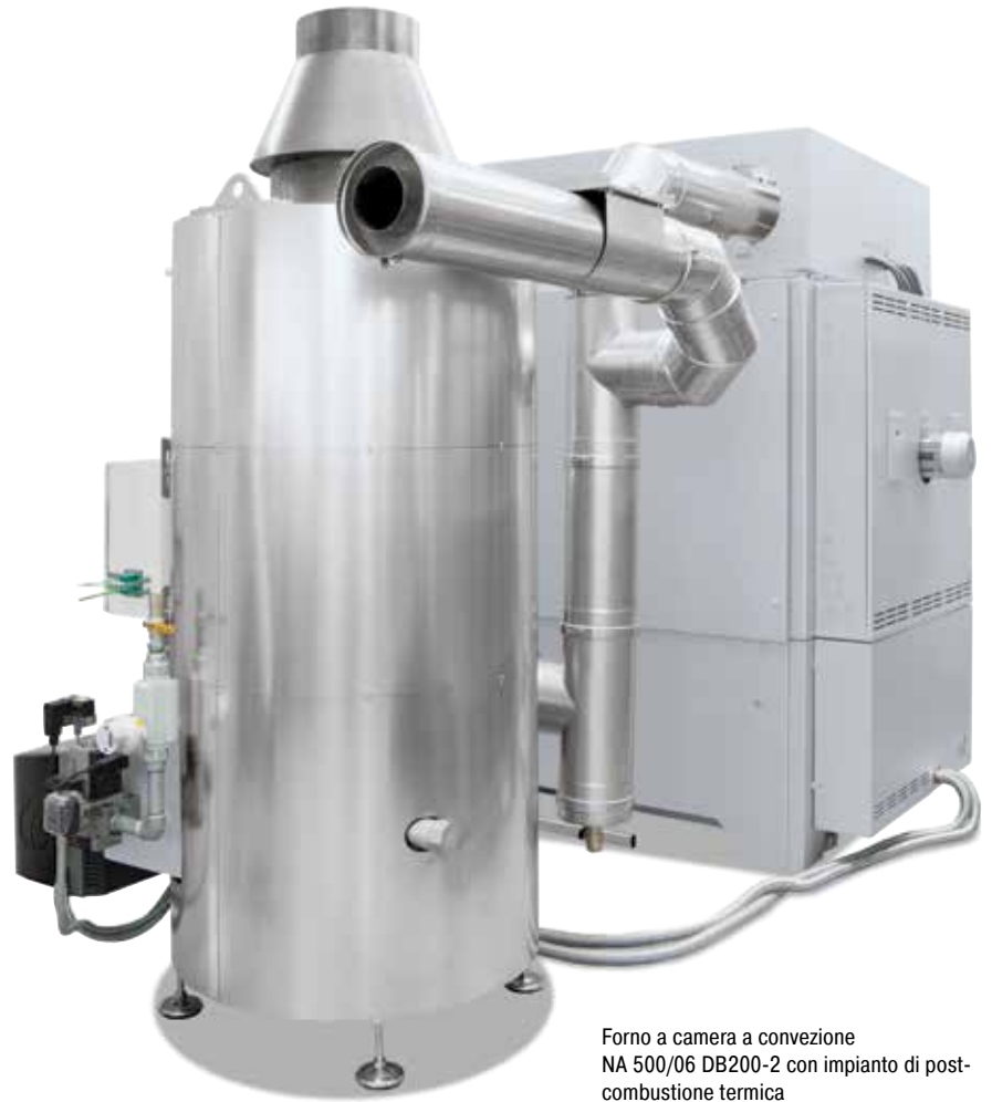
Forno a camera a convezione NA 500/06 DB200-2 con impianto di post-combustione termica