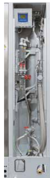
Depuratore dei gas di scarico per la pulizia dei gas di processo mediante lavaggio

Un depuratore di gas viene spesso utilizzato quando si formano gas di scarico che non possono essere trattati con un post-bruciatore termico o una torcia, per pulire, decontaminare o disintossicare i gas di scarico si utilizza un liquido di lavaggio. I componenti indesiderati dei gas di scarico vengono separati da un fluido di lavaggio all'interno del dispositivo di lavaggio. Selezionando il liquido di lavaggio idoneo e dimensionando la distribuzione del liquido e la sezione di contatto è possibile adattare il dispositivo di lavaggio al processo, eliminando dal gas di scarico componenti gassose, liquide o anche solide.