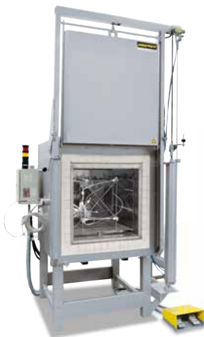
Supporto di misurazione per la determinazione dell'uniformità della temperatura

Nel forno standard è garantita un'uniformità della temperatura in +/- K senza la necessità di misurare il forno. Come dotazione aggiuntiva è tuttavia possibile ordinare la misurazione dell'uniformità della temperatura a una temperatura nominale definita nello spazio utile secondo DIN 17052-1. In base al modello del forno, nel forno si allestisce un supporto corrispondente alle dimensioni dello spazio utile. Delle termocoppie vengono fissate in questo supporto, in posizioni di misurazione definite (11 con sezione rettangolare, 9 con sezione circolare). La misurazione della distribuzione della temperatura si svolge a una temperatura nominale definita dal cliente, dopo un tempo di tenuta precedentemente stabilito. Se richiesto, è possibile calibrare anche temperature nominali diverse o un determinato intervallo di temperatura.