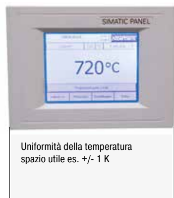
Uniformità della temperatura spazio utile es. +/- 1 K