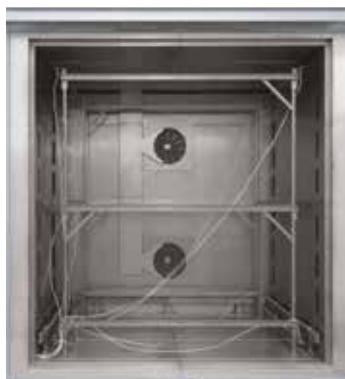
Telaio da assemblare per la misurazione nel forno a circolazione d'aria N 7920/45 HAS