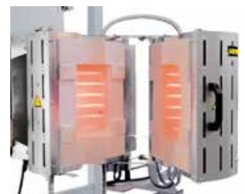
RS 100/250/11S in versione apribile, installabile in un'attrezzatura di prova