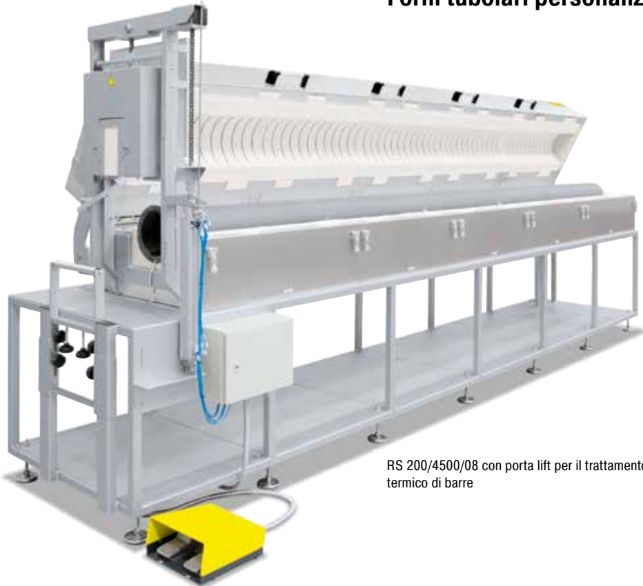
RS 200/4500/08 con porta lift per il trattamento termico di barre