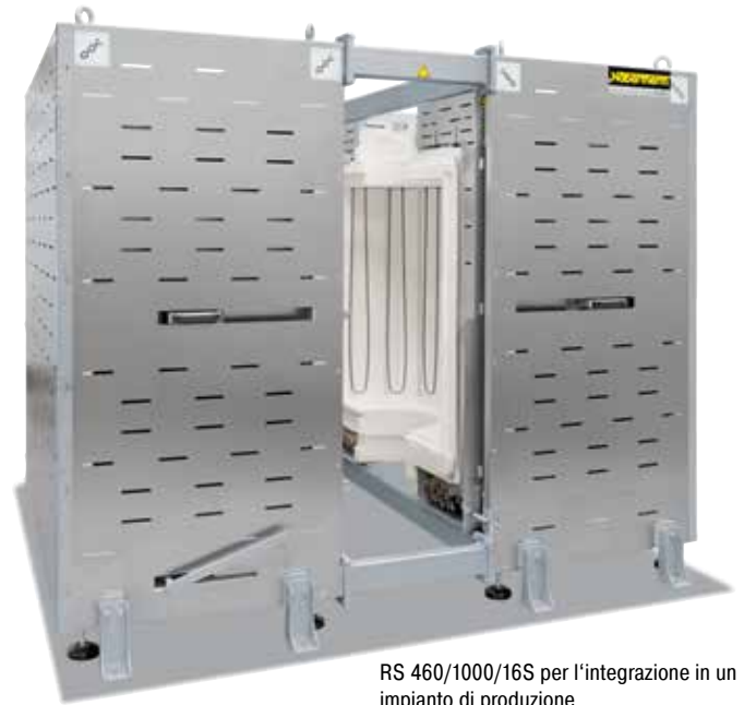
RS 460/1000/16S per l'integrazione in un impianto di produzione

Grazie all'elevato grado di flessibilità ed innovazione Nabertherm offre la soluzione ottimale per applicazioni specifiche del cliente.