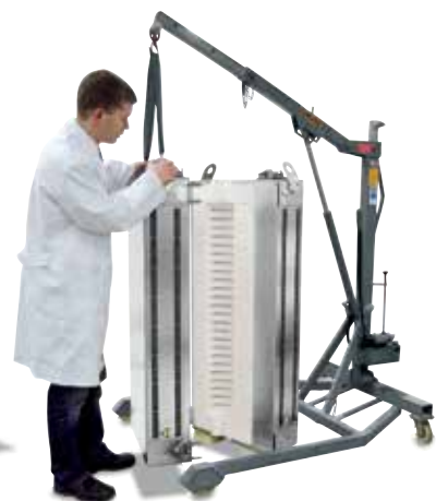
RS120/1000/11S en version séparée. Les deux demi fours sont fabriqués à l'identique et seront intégrés à un système de chauffage au gaz existant, dans un concept de gain de place