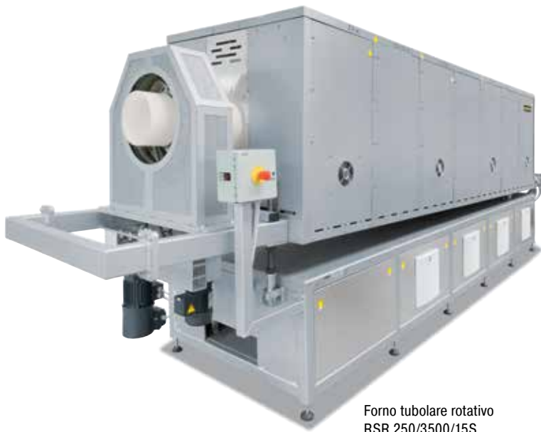
Forno tubolare rotativo RSR 250/3500/15S