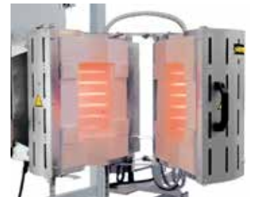
RS 100/250/11S in versione apribile, installabile in un'attrezzatura di prova

Sulla base dei nostri modelli base elaboriamo anche varianti personalizzate integrabili in impianti di processo superiori. Le soluzioni presentate sulla presente pagina rappresentano soltanto una parte delle possibilità realizzabili. Dal lavoro in atmosfera sottovuoto oppure sotto gas inerte attraverso tecniche di regolazione ed automazione innovative fino alle più svariate temperature, dimensioni, lunghezze e proprietà degli impianti a forni tubolari – troviamo la soluzione adatta per l'ottimizzazione del processo.