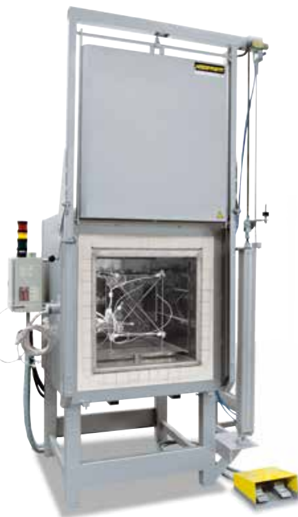
Supporto di misurazione per la determinazione dell'uniformità della temperatura